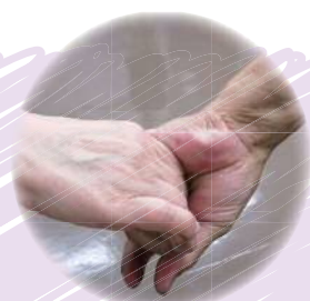
こんな場面も・・・

ライオン笑い・ジェットコースター笑い・ツイスト笑いなど、そのものに“なりきって”自由に笑い、動きます。